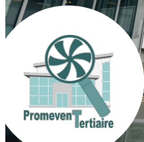
Tour Eria - Architecte : 2|Portzamparc - Observatoire BBC