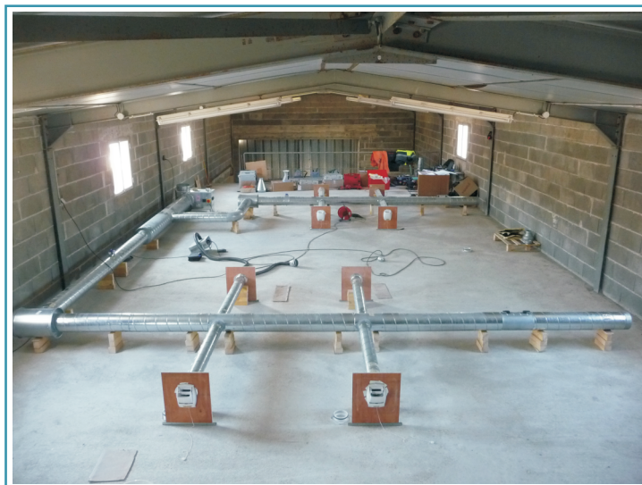
Fig 2 : Réseau test expérimental - S. Berthault - Cerema DTerCE - Autun

Source : S. Berthault, F. Boithias, V. Leprince. Ductwork airtightness: reliability of measurements and impact on ventilation flowrate and fan energy consumption . 35th AIVC Conference. 2014